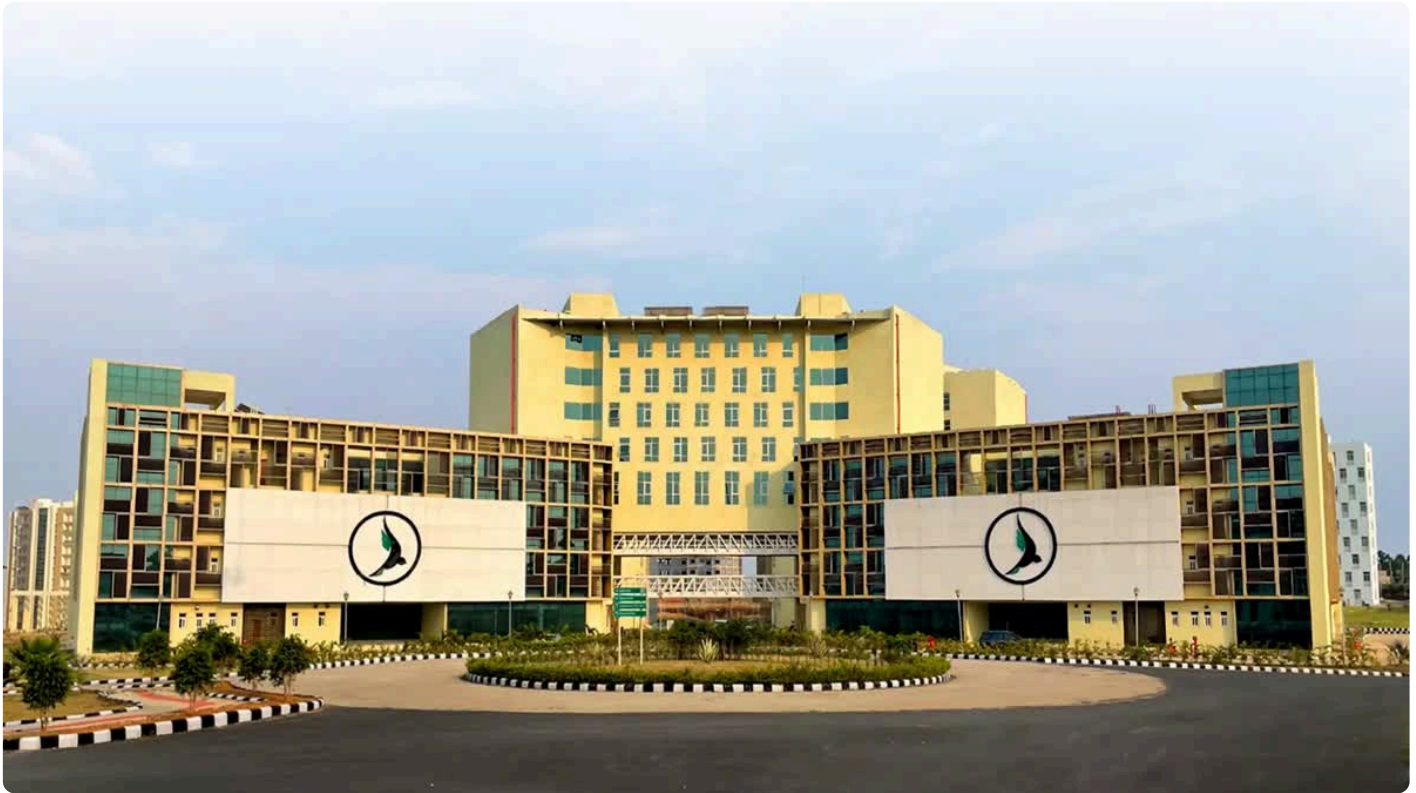
आईआईएम रांची प्लेसमेंट 2025-26

आईआईएम रांची के एग्जीक्यूटिव एमबीए के एक छात्र को 1.2 करोड़ रुपये का पैकेज मिला है।